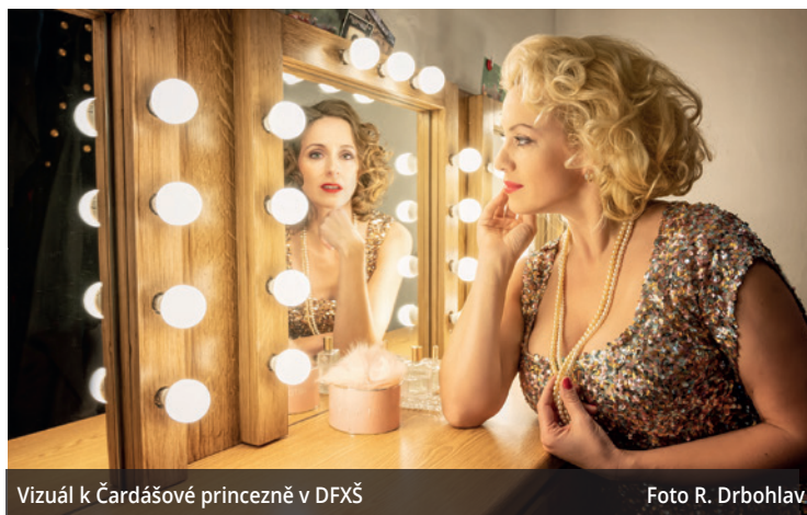
Vizuál k Čardášové princezně v DFXŠ

Kálmán začal operetu komponovat v roce 1914 během svého pobytu v Mariánských Lázních a původně nesla název Ať žije láska! Příběh se odehrává na počátku 20. století. Zpěvačka a tanečnice Sylva