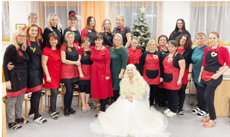
Kolektiv MŠ Beruška

V ruprechtické mateřské škole Beruška jsme sedmý rok za sebou připravili pro děti a jejich rodiče Kouzelné adventní odpoledne, které letos zahájil pěvecký sbor Berušky.