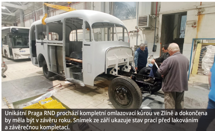
Unikátní Praga RND prochází kompletní omlazovací kúrou ve Zlíně a dokončena by měla být v závěru roku. Snímek ze září ukazuje stav prací před lakováním a závěrečnou kompletací.

Výstavu v Technickém muzeu Liberec připravil spolek Boveraclub za využití svého bohatého archivu, ale také i díky finanční podpoře Libereckého kraje. Panely s fotografiemi doplňuje projekce