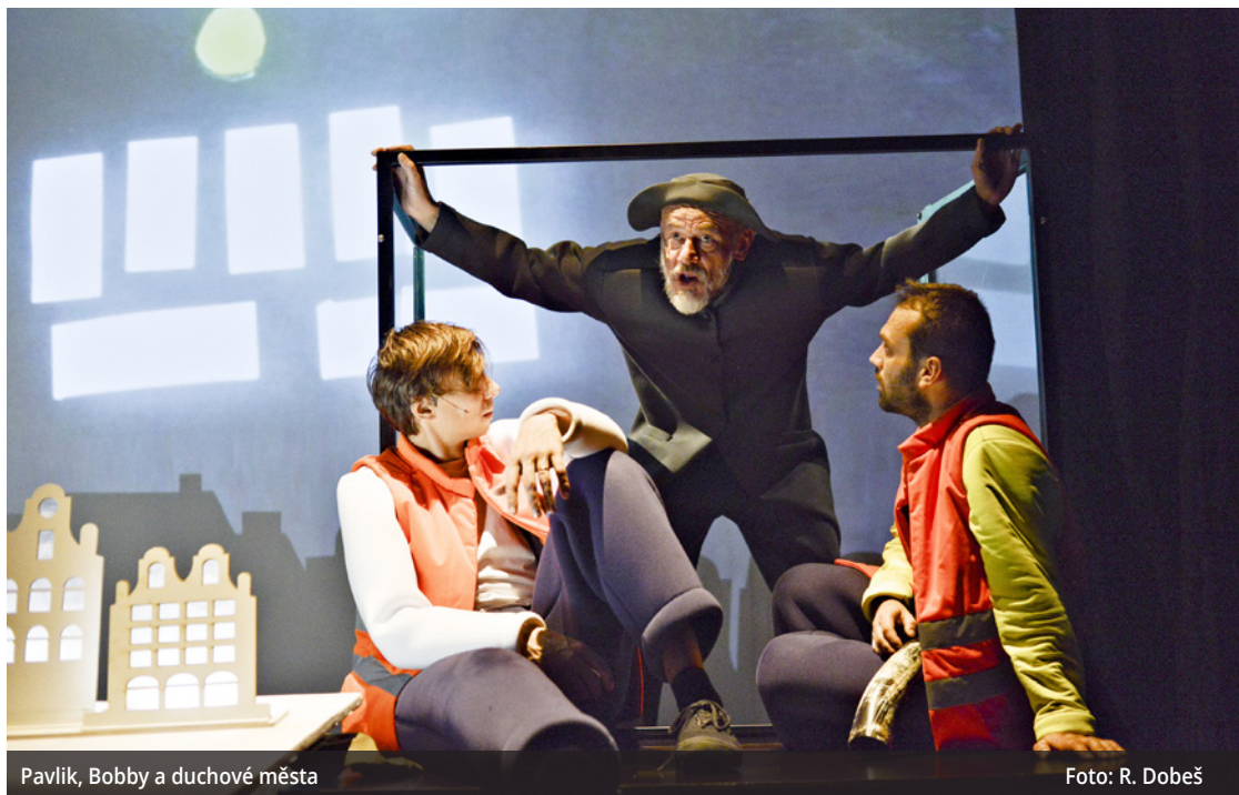
Pavlík, Bobby a duchové města

Další oslava proběhne v divadelním stánku v Moskevské ulici hned o dva dny později – ve středu 28. prosince v 10.00 hodin . Konkrétně půjde o významné životní jubileum babičky jedné malé dívky, která proslula nošením červeného čepečku. A důvody k oslavě budou ten den hned dva: inscenace Babička Červené Karkulky dnes slaví narozeniny! byla totiž před pár dny při udělení ceny ERIK odborníky vyhlášena za třetí nejlepší českou loutkovou insce-