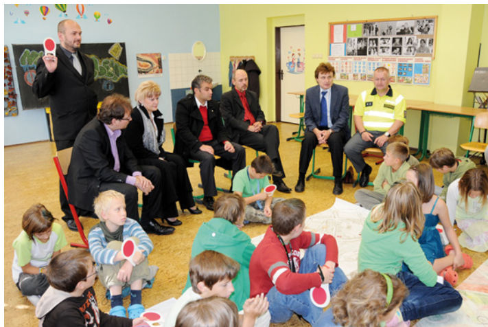
PŘEDÁNÍ. Děti ukázaly členům vedení města své dopravní mapy a předaly studii, která řeší bezpečnější přístup do školy.