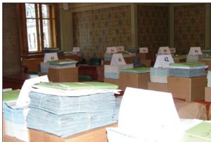
Připravené volební materiály