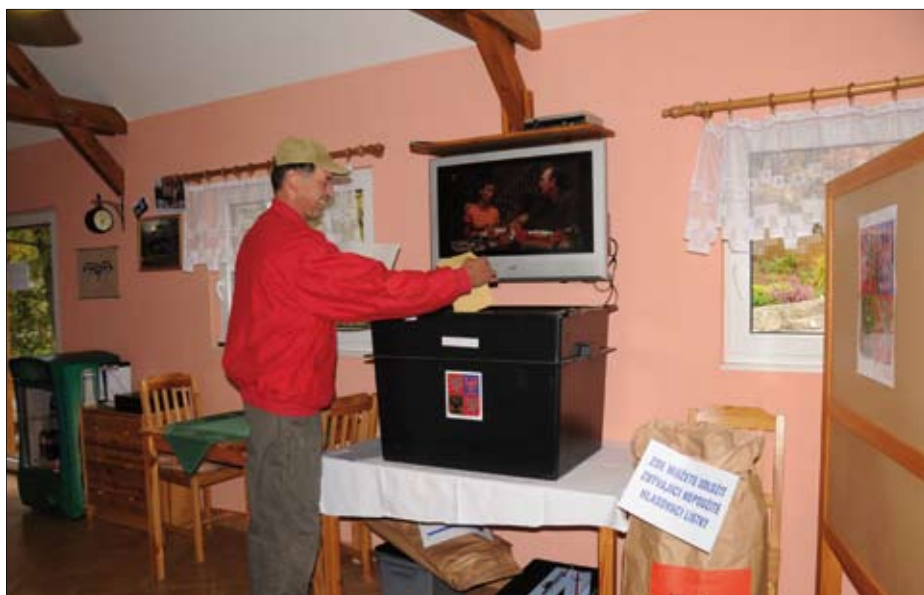
Raritou komunálních voleb v Liberci bylo pravděpodobně nejmenší volební místnost, jíž se stala Pizzeria La Bonnacia v Liberci-Radčích