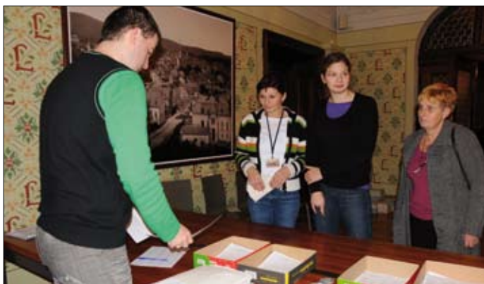
Veškeré volební dokumenty v papírové podobě předávali členové volebních komisí pracovníkům magistrátu

Celá pracovní skupina čítá 22 lidí z řad zaměstnanců magistrátu a tři externí informatiky. Všichni tito lidé zajišťují volby po stránce organizační a technické. Příprava věcí potřebných pro zdárný průběh voleb trvá několik stovek hodin. Nejde jen o vytištění volebních lístků a jejich distribuci do schránek občanů. Magistrát v případě říjnových voleb mimo jiné přijímá kandidátní listiny pro volby do zastupitelstev obcí (včetně kandidátních listin pro obce Dlouhý Most, Jeřmanice, Šimonovice, Stráž nad Nisou), a přihlášky k registraci pro volby do Senátu, nechává tisknout volební lístky, zpracovává seznamy voličů, vydává voličské průkazy, zajišťuje volební místnosti a veškeré jejich vybavení volebními schránkami počínaje přes kancelářské potřeby, výpočetní techniku, vlajku, mýdlem a ručníkem konče. Stohy bílých ubrusů, balíky obálek, hlasovacích lístků, USB disky a počítače, nástěnky, špendlíky, tužky, razítka. To všechno označené číslem příslušného volebního okrsku se v týdnu před volbami postupně připravovalo do zasedací místnosti historické radnice. Zapisovatelé a předsedové jednotlivých volebních komisí si během pátečního dopoledne všechny věci potřebné pro vybavení „té své“ volební místnosti odváželi. V pátek ve 14 hodin, kdy se otvírají volební místnosti a volby začínají, musí být vše perfektně připraveno v souladu s platnou legislativou. Zapomenout