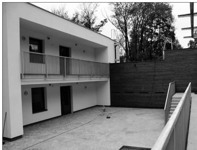
Atrium dětského centra; spánek v kočárku na čerstvém vzduchu umožňují dětem prostorné terasy

„V rámci kompletní rekonstrukce byla provedena přístavba spojovacího krčku a kanceláří se schodištěm, zbudovány dva výtahy, nové příčky, výměna oken a dveří, byla položena nová střešní krytina, včetně zateplení střechy a fasády. Prostory mají nové podlahové krytiny, obklady a dlažby. Došlo k rekonstrukci rozvodů vnitřního vodovodu a kanalizace, topení, elektroinstalace a hromosvodu. Postavila se také nová opěrná stěna, která přispěla k rozšíření zahrady, na níž je umístěno brouzdaliště pro děti,“ vypočítává provedené úpravy náměstkyně primátora pro věci sociální Naďa Jozífková.