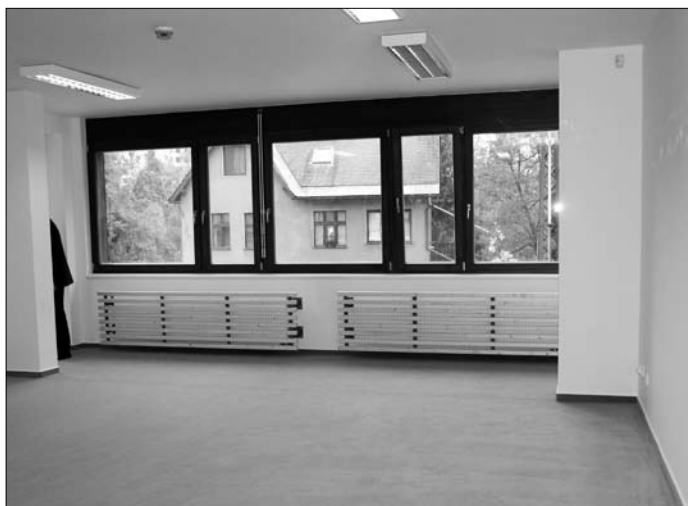
Prostorná a světlá herna bude sloužit k setkávání a společným hrám

Provoz Dětského centra Sluníčko je doposud rozdělen do dvou samostatných budov. V budově Husova 91 jsou umístěny děti od narození zpravidla do 1 roku věku, o starší děti do 6 let je pečováno v budově U Sirotčince 407. Díky novému areálu v Pekárkově ulici dojde nejen ke zjednodušení provozu a snížení nákladů, ale také ke zkvalitnění péče o děti. Dosavadní objekty totiž nesplňují požadavky na zázemí co nejvíce podobné rodinné péči. V Pekárkově ulici jsou zřízeny čtyři rodinné buňky, dále kojenecké oddělení, jednotka pro handicapované děti a děti sondované. Novinkou jsou i prostory, kde mohou žadatelé o dítě pobývat s dítětem a vzájemně si na sebe zvykat. Je zde také zázemí pro utajené porodů. V rodinných buňkách, které mají podobu bytu se samostatnou