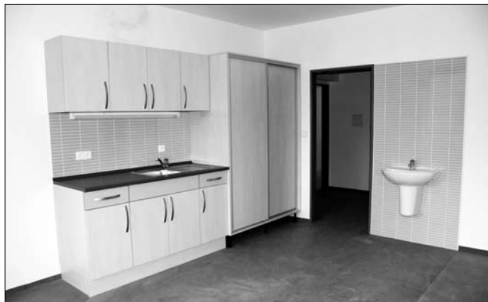
Rodinné buňky jsou vybaveny kuchyňským a jídelním koutem, vestavnými skříněmi a koupelnou s nízkou posazenými toaletami tak, aby co nejvíce vyhovovaly malým obyvatelům

Nový areál Dětského centra Sluníčko v Pekárkově ulici dostává konečnou podobu. V úterý 5. října se zde uskutečnil poslední kontrolní den a městská příspěvková organizace se do nově zrekonstruovaných prostor přesune v polovině listopadu.