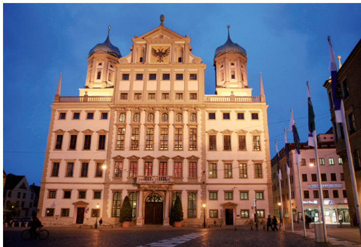
MĚSTO. Radnice v Augsburgu ze Zlatým sálem.