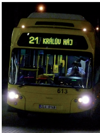
DANĚ. Z daňových příjmů dotuje město například MHD.

Daň z nemovitosti je jakýmsi poplatkem za to, že ta konkrétní nemovitost je obsluhována městem. Za to, že k ní vedou (v rámci možností) uklízené a v zimě upravované cesty, za to, že obyvatelům kolem ní v noci svítí osvětlení a městská policie přijede na zavolání. Za to, že autobus přijede na zastávku včas, a za to, že město připlácí šílené peníze za svoz odpadků. Jsou to věci samozřejmé, ty,