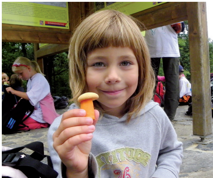
PRÁZDNINY. Příměstské tábory získávají na oblibě u dětí i rodičů. V Liberci máte na výběr z několika možností.

Letní školičku nabízí také sdružení Motyčkovice Klika , a to hned v několika turnusech www.motyckovicklika.cz