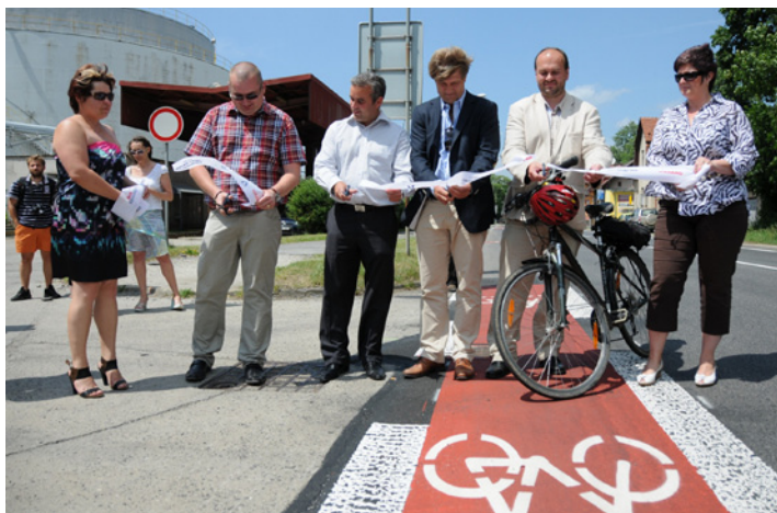
NA KOLO. Zástupci města, kraje a stavební firmy otevřeli na začátku června novou cyklostezku na třídě Dr. Horákové.