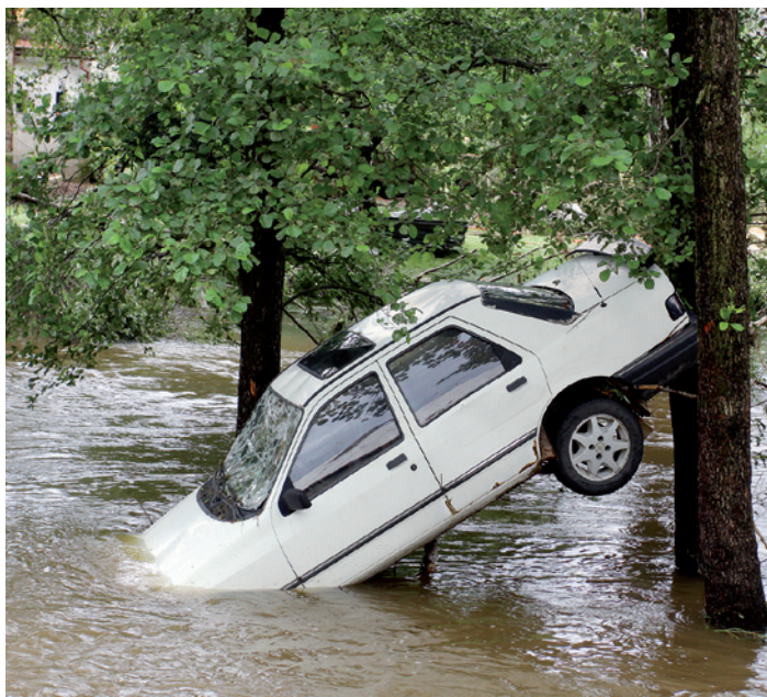
ZKÁZA. Loňské povodně ničily majetek, silnice, mosty i lidské životy. Vedení města nyní jedná o pokračování protipovodňových opatření v Liberci.