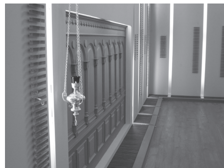
Část obřadní síně

k připomínání historie, ale také k pořádání kulturních a vzdělávacích akcí. Je přístupný v nadcházejícím letním období v úterý a ve čtvrtek od 16 do 18 hodin a v neděli od 14 do 17 hodin.