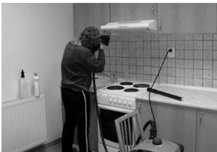
Před otevřením centra probíhaly poslední úklidové práce

Přestože někteří občané se podivovali nad umístěním denního centra do středu Liberce, právě jeho poloha má své opodstatnění.