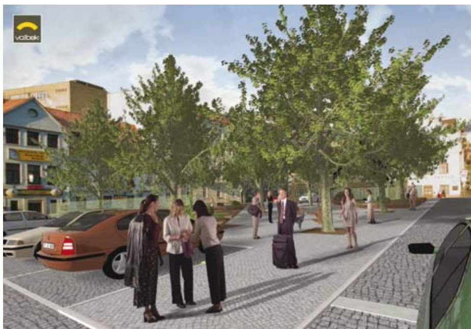
Takto by mělo po úpravách vypadat v budoucnosti Nerudovo náměstí