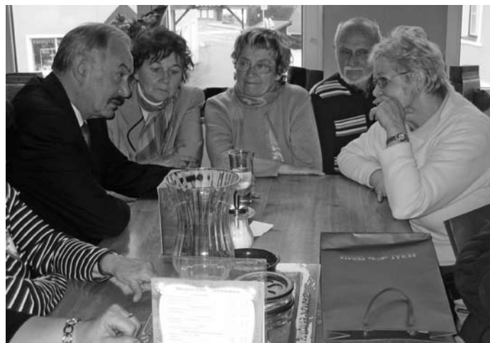
Předseda Senátu PČR Přemysl Sobotka se setkal s libereckými seniory Komunitního střediska Kontakt, kteří se zúčastnili zájezdu do Harrachova

Dva počítačové kurzy se uskuteční zdarma pro seniory v termínech od 19. 7. do 23. 7. 2010 v Komunitním středisku Kontakt Liberec, Palachova 504/7, Liberec (budova bývalé ZUŠ, počítačová učebna v podkroví). Zájemci o tyto kurzy se mohou přihlásit od 17. 5. do 11. 6. 2010 na recepci v Klubu seniorů