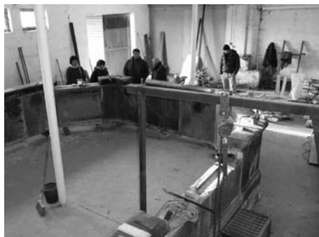
Pohled do restaurátorské dílny

Práce na náměstí zahrnují například výstavbu armaturní šachty pro technologie, přípojky vody, elektro a kanalizaci. Samotná kašna bude stát na betonovém vyrovnávacím soklu a po její pravé i levé straně se instalují lavičky a další městský mobiliář. Liberečané však musí počítat s tím, že dosavadní rozmístění sloupů veřejného osvětlení zmizí. „Sloupy s veřejným osvětlením budou sejmuty