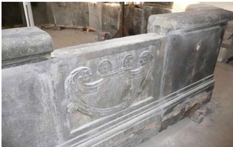
Jednotlivé zrestaurované díly Neptunovy kašny v restaurátorské dílně, odkud budou převezeny k montáži na náměstí Dr. E. Beneše. Kámen s reliéfem je jednou z dvou bočních desek vany kašny zdobené motivem s německými nápisy.