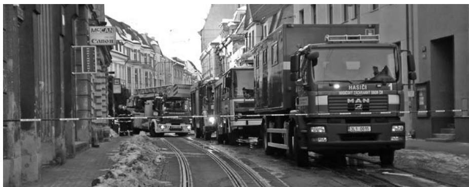
Požár podkroví v ulici 5. května, k němuž došlo 25. ledna, zablokoval na několik hodin dopravu. Na místě zasahovali dobrovolní hasiči z Vratislavic nad Nisou, Krásné Studánky a Růžodolu I, profesionální jednotka ze stanice Liberec, Policie ČR i Zdravotnická záchranná služba LK.

Další informace o libereckých jednotkách dobrovolných hasičů naleznete na www.liberec.cz v sekci Magistrát a radnice – odbor kancelář tajemníka – odd. krizového řízení.