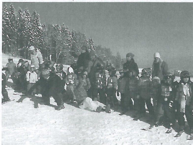
Lyžařský kurz v lednu 2012